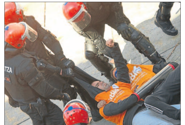
La Ertzaintza derribó a golpes el muro popular levantado en solidaridad con Zaldibar, Robles y Esteban.