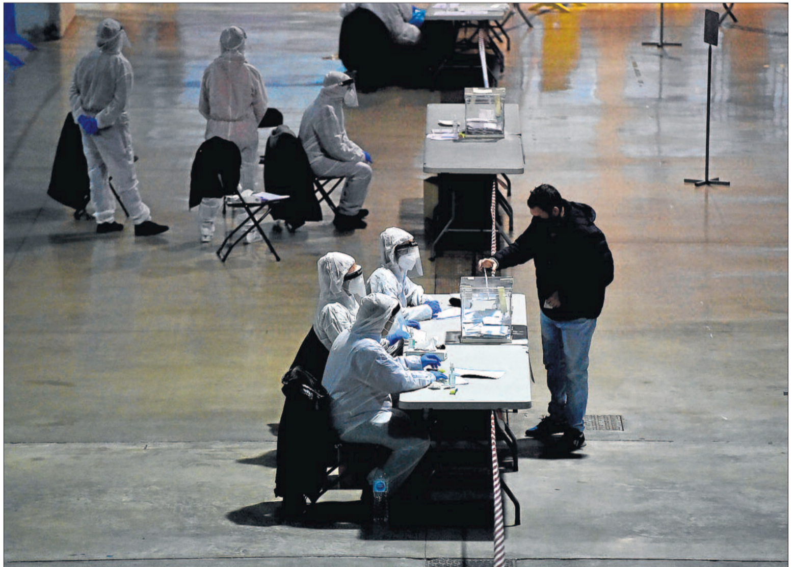
Una persona confinada por covid-19 ejerce su derecho al voto en una mesa con sus componentes protegidos con EPIs, en L'Hospitalet de Llobregat.

Pandemiak atzoko bozak baldintzatu zituen eta abstentzioa nabarmen igoda (%53,5). Hauteslekuen zenbait irudi harrigarriak dira: ebakuntza gelak dirudite. Halere, desengainua ere egon daiteke abstentzioaren atzean. >3