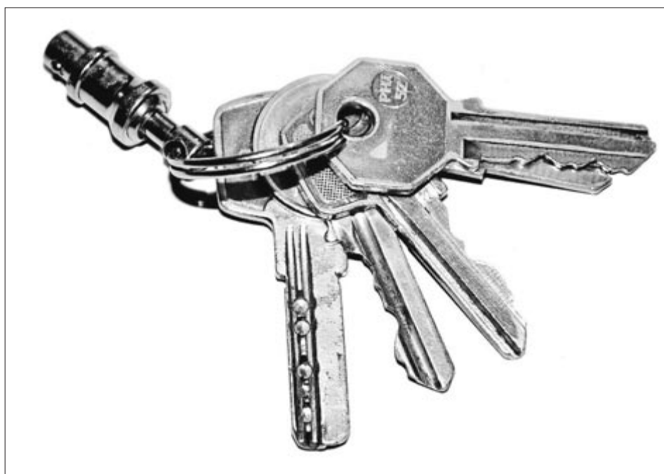
Gero eta gehiago omen dira Europar Batasunean emantzipatu nahi eta ezin duten langile gazteak.

Laburbilduz, ondorio psikologiko kaltegarriak ekar ditzake emantzipatzerik ez izateak. Hala, garrantzitsua litza-teke egoera hori sortzen duten lan-baldintzak eta etxebizitzaren prezioak duintzeko beharrezkoak diren egiturazko aldaketak egitea. •