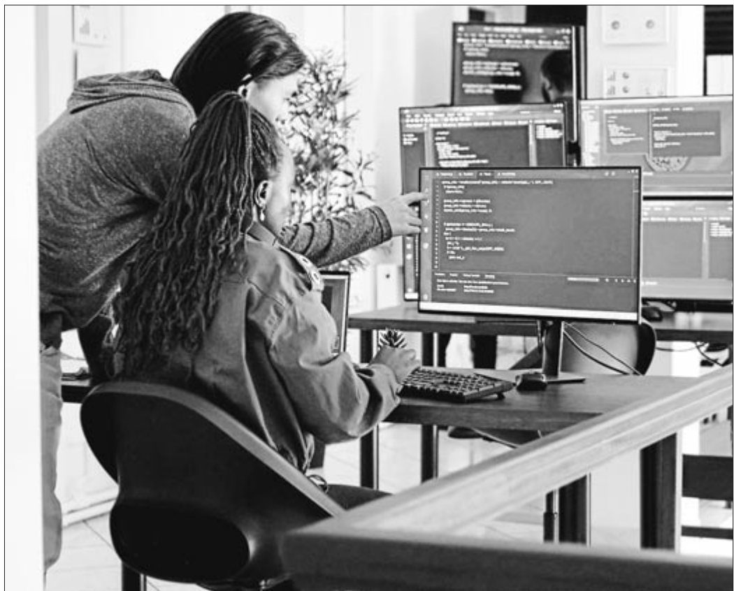
Pentsa dezagun adimen artifizialean tresna gisa, ez kreatura/izaki gisa.

‘Adimen artifizial’ kontzeptuaren barnean egindako aurrerapen zientifikoak ikaragarriak dira, eta jarraitzen dute izaten, ez nuke kontrako mezua zabaldu nahi inola ere. Haren erabilera egokia oso onuragarria izan daiteke. Baina ‘adimentsu’ kontzeptuaren mitologizazio horri aurre egin beharko genioke. Bide horretan zientzialariok erronka eta ardura dugu: gure eremuko zenbait ingurune espezifikotatik (enpresa teknologiko handietatik, batez ere, eta modu interesatuan) atmosfera apokaliptikoa sortzeaz gain, agian ez dugu ondo azaltzen adimen artifiziala zer den eta nola funtzionatzen duen. Onartu beharra dago, era berean, Lanier-ek seinالاتu bezala, erabiltzen den ohiko terminologia ez dela lagungarria tresna itxura –eta ez izaki itxura– irudikatzeko, ‘adimen artifizial’, ‘neurona’, ‘neurona-sare’ eta antzeko termino biologikoekin. •