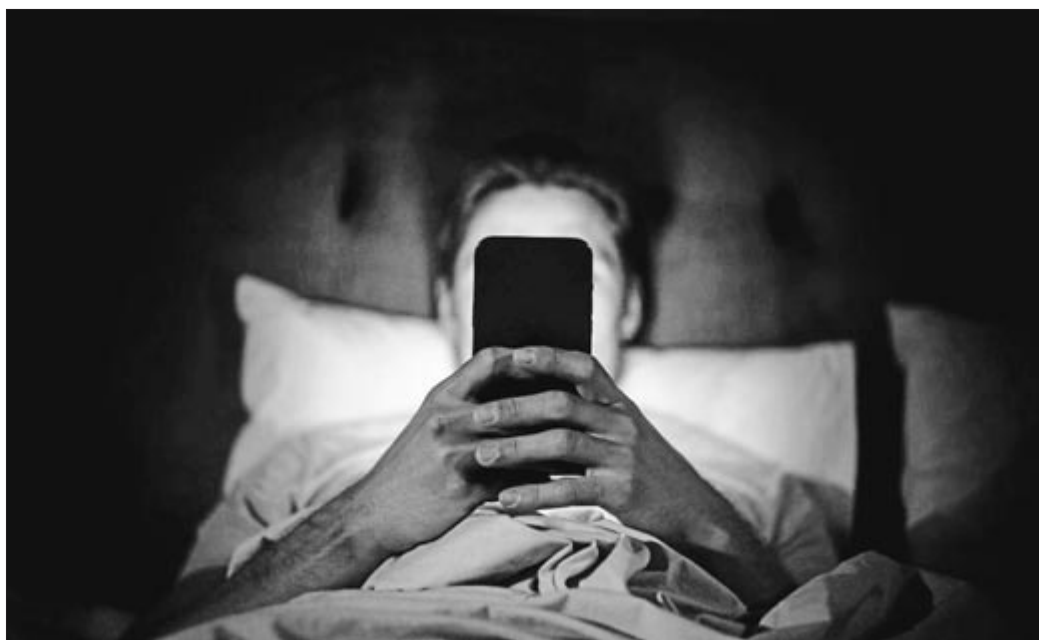
Sareen eragina onartzea funtsezkoa da ongizate emozionala babesteko.