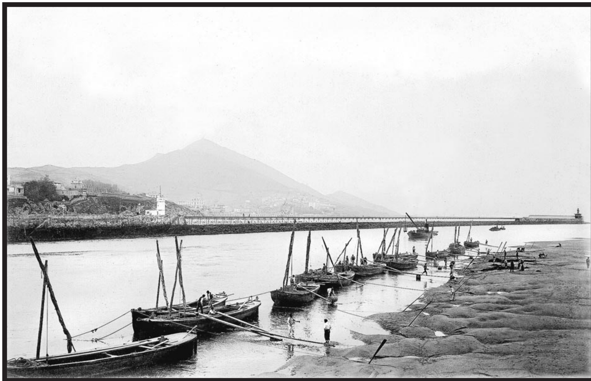
BILBOKO PORTU AGINTARITZA