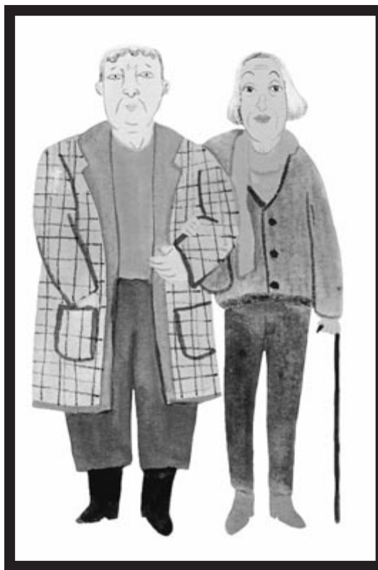
Ezkerrean, Katalina eta Maritxu, «Dardarak» album ilustratuan. Eskuinean, Erdi Aroan lesbianismoa nola irudikatzen zuten erakusten duen ilustrazioa. DARDARAK ARTXIBOAN

“Dardarak artxiboan” erakusketak prestatzeko mila begirekin behatu dituzte epaitegiatarako artxiboak, baita garaiko literatura ere. Lerro artean eta zorrotz irakurriz, pista esanguratsuak topa baitaitezke. Bide horretan, ‘testu lesbikoak’ topatu dituzte, maiz manipulatutakoak, «harreman heterozentratuetatik eta genero arauetatik ihes egiten zuten bestelako