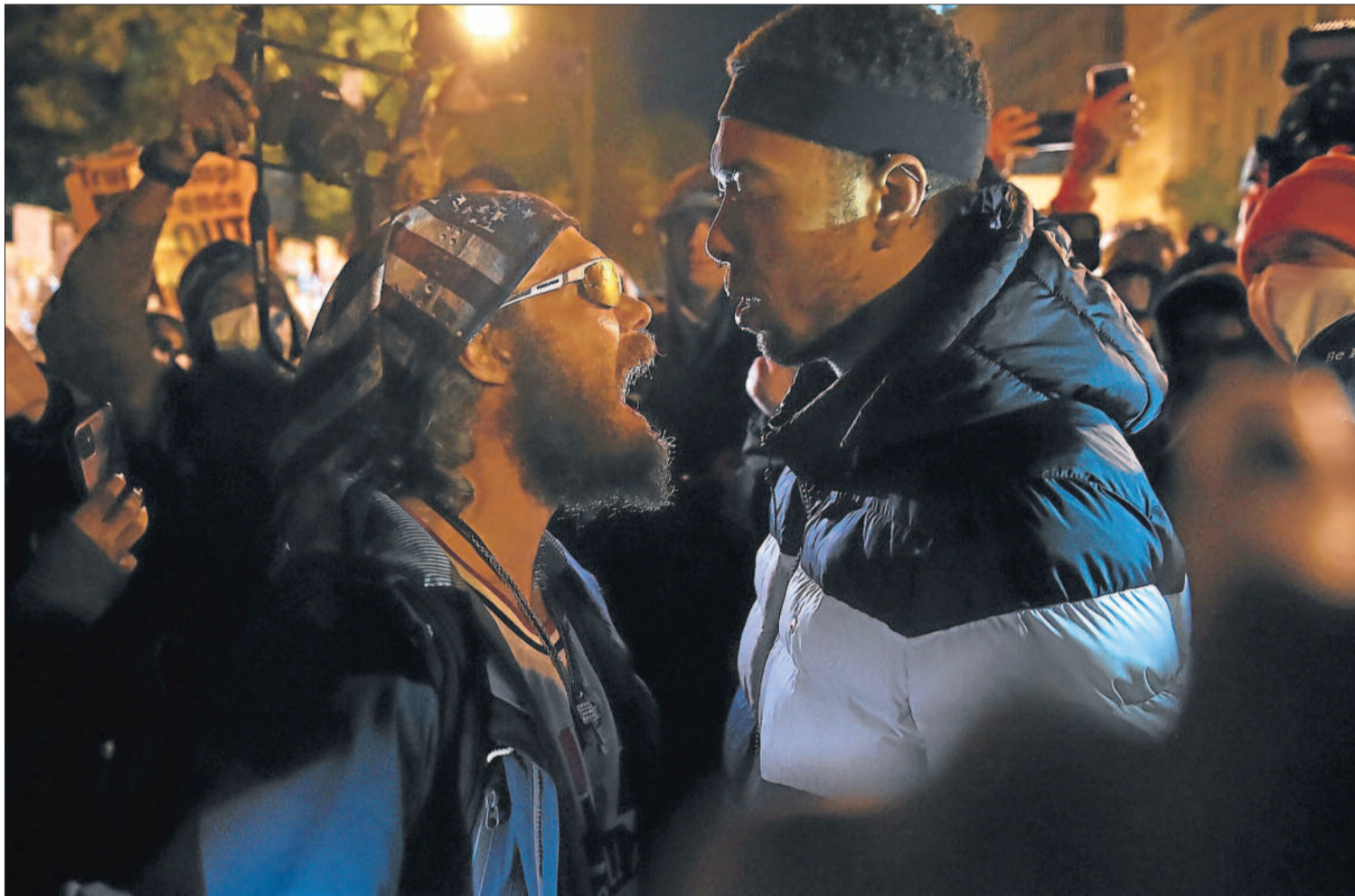
Imagen de la noche electoral que simboliza la polarización: un seguidor de Trump chilla a un manifestante de Black Lives Matter en Washington DC.