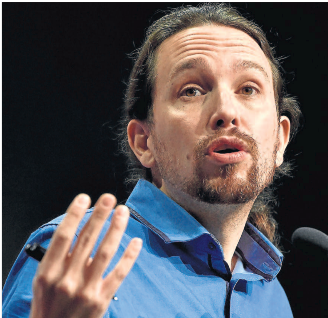
Pablo Iglesias, líder de Podemos, introdujo el derecho a decidir como prioridad de nuevo ayer.