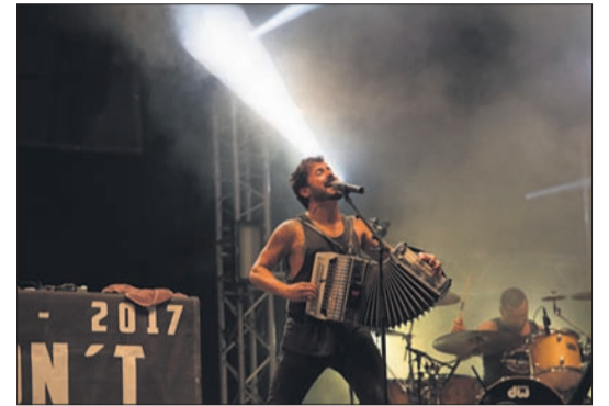
Esne Beltza actuará el jueves 24.