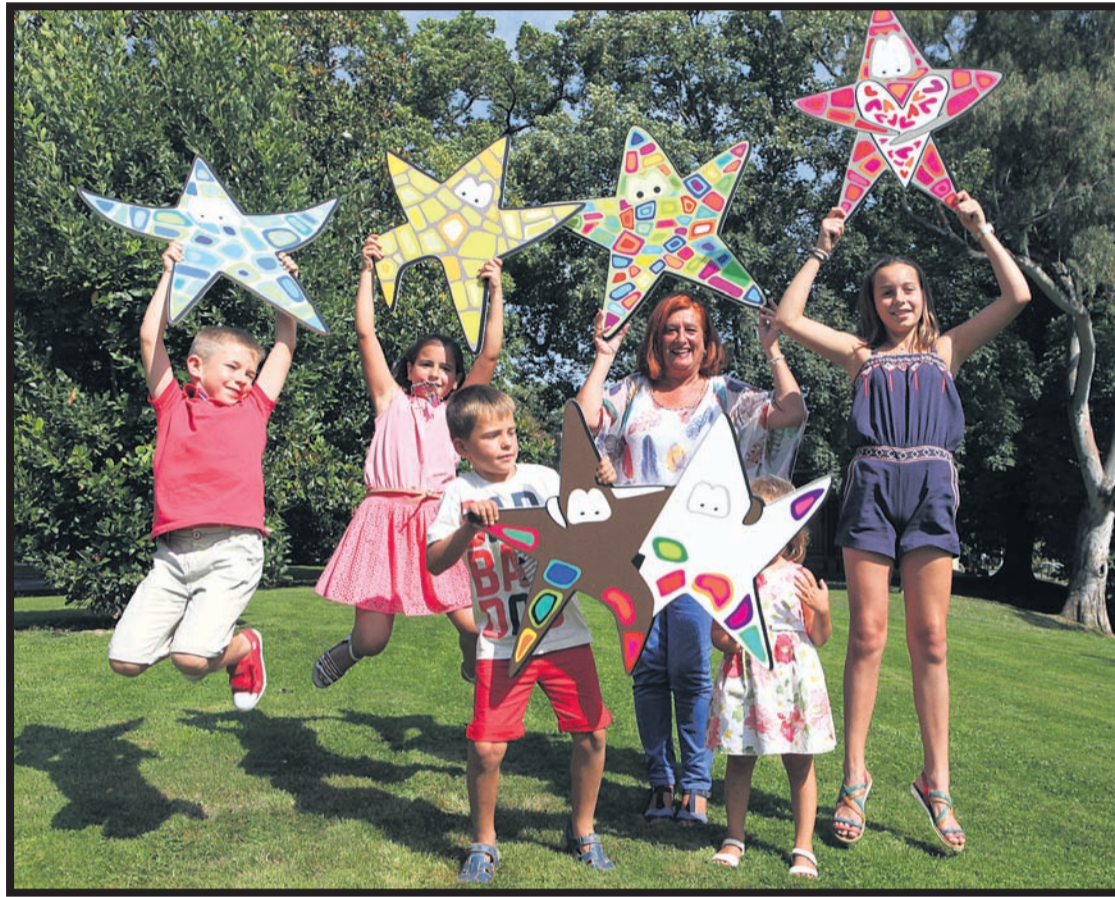
Txikigunea osatzen duten lau espazioak Casilda Iturrizar parkean kokatuko dira. GARA

Aurten berrikuntza ugari izango ditu. Besteak beste, «makillaje ibiltaria», horretarako umek antolaturiko lau gunetatik bilatu beharko dute, horrela beste urteetan izandako ilarak ekiditea nahi dute. Segurtasunagatik 10.000 esku-mutur egongo dira umek galtzekotan identifikatzeko. Azkenik, 25 minuturo, Kale Nagusiaren 60. zenbakian Txu txu trenak hartzeko aukera egongo da.