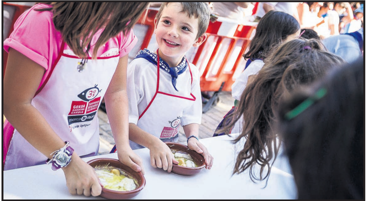
Una pareja disfruta preparando una cazuela de kokotxas de bacalao en la pasada edición del certamen.

Este año, como primicia, dará inicio el lunes 21 con un plato vegano, las patatas en salsa verde. Como base se utilizará para ello la receta del mítico restaurante "Amparo", una receta tradicional de Bilbo. Con esta iniciativa se ha querido visibilizar la cocina vegana, que también