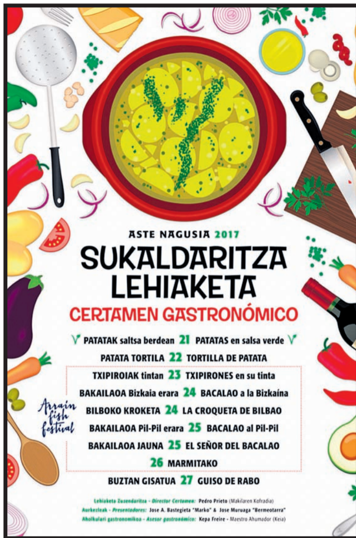
Cartel anunciador del certamen gastronómico.