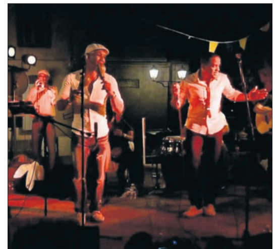
El grupo cubano Septeto Nabori.