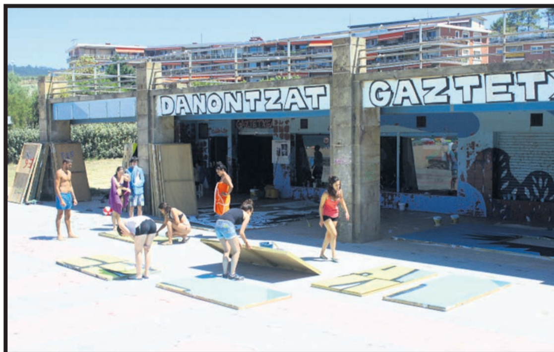
Plentziako Gaztetxean prestatutako lana ez da larunbata arratsaldera ezagutzera emango. GARA

Bukatzeko, larunbat arratsaldeko 19:00etan Marijaiari harrera egingo diote, eta bertara gerturatzen den jenderentzat sorpresa bat prestatu dute haien panelak desestaliz.