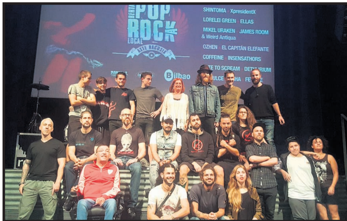
Presentación del certamen, el pasado día 13 de julio. GARA

Grupos como Zea Mays, We are standard o Platero y Tú se han dado a conocer en el certamen