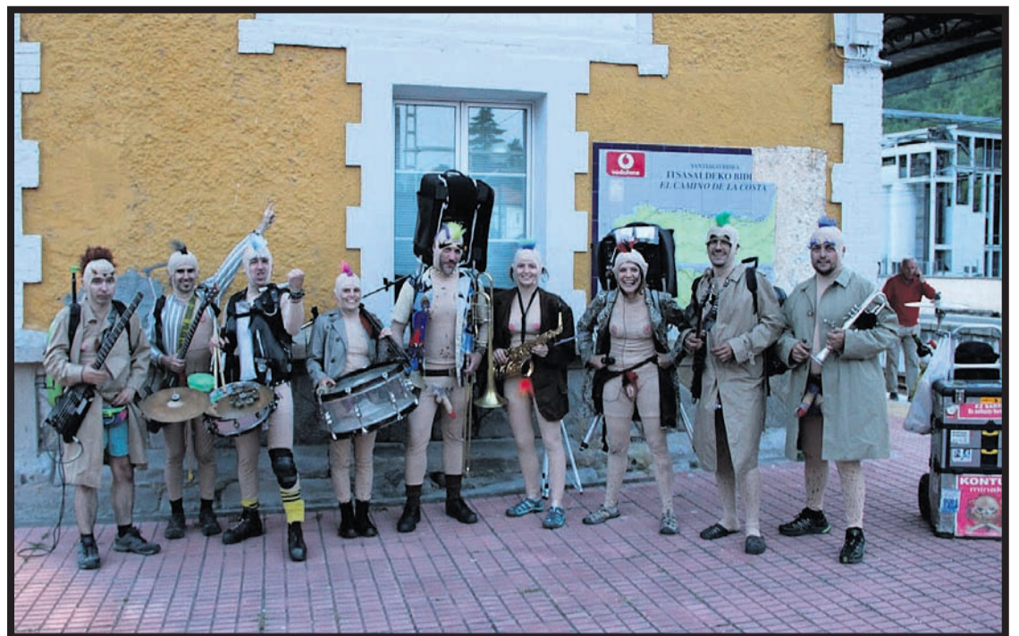
Taldearen emanaldietan bederatz lagunek jotzen dute, guztira hamahiru kide badira ere.

Ez dira inongo egitarautan ageri eta beren helburua, gaupaseroei omenaldi xume bat eskaintzea da