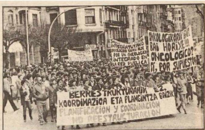
La manifestación de ayer en apoyo al Oncológico.

Biztanleriak hautemandako balioetako bat paziente onkologikoei ematen zitzaien tratua ona zen, eta hala izaten jarraitzen du; izan ere, asistentzia-jardunbide egoki horretan oinarrituta, "Onkologikoa estiloa" sortu zen, gaur egun arte jarraitu dena.