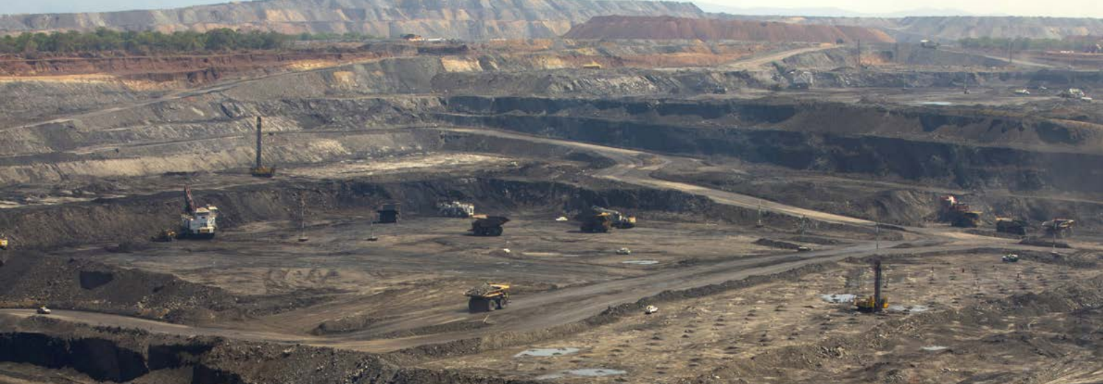
Maquinaria operando en una mina anexa a la mina de carbón Cerrejón en Barrancas, La Guajira, Colombia.