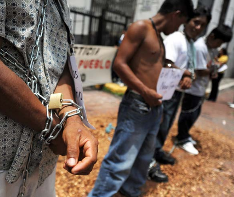
Activistas indígenas Naso se encadenan uno al otro durante una protesta en el Palacio Presidencial en la Ciudad de Panamá, en 2009. El pueblo Naso ha exigido el reconocimiento formal de sus derechos a la tierra por décadas.