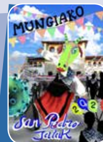
DOLORES TRANCHE BENITEZ