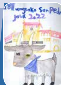
KEA AZPIAZU BODON (8 urte) finalista