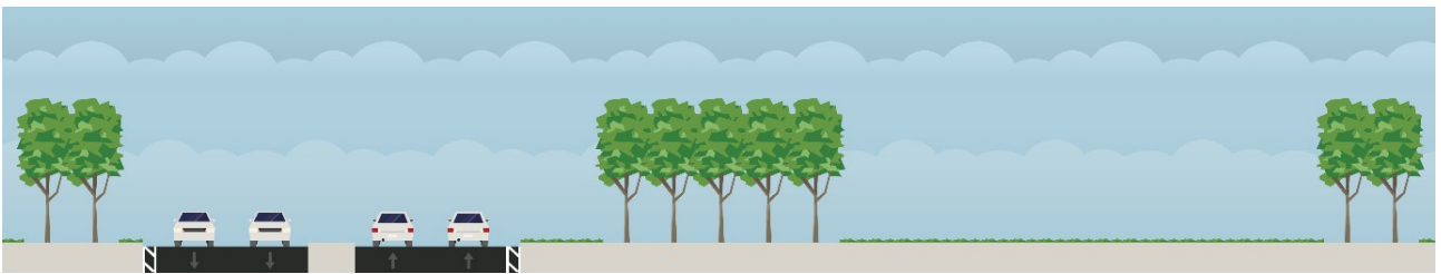
Irudia 2. Geldituko litzatekeen espazio librea saihebideta autobide izatetik hiribide izatera pasako balitz. StreetMix bidez egina.

Testuinguru horretan, joan den urtarrilaren 29an, Donostiako EH Bilduk prozesu parte-hartzaile bat aurkeztu zuen, eraldaketa hori nola gauzatu den erabakitzeko eta libratuko diren eremuetan zer egin behar den aztertzen hasteko. Helburua da saihebidetarako zeharkatzen dituen eremuetan bizi diren bizilagunen iritziak, proposamenak eta kezkek biltzea, bai eta hiri zein auzo mailan diharduten gizarte eragileek ere.