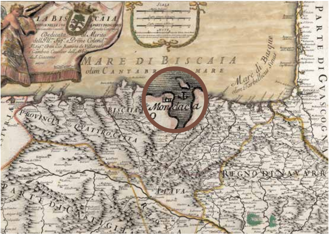
Giacomo Cantinelli egindako mapa. 1696