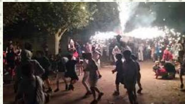
ACCESIT / AKZESITA: MIKEL HUARTE GOLDARACENA "Jugando con fuego" (Suarekin jolasten)