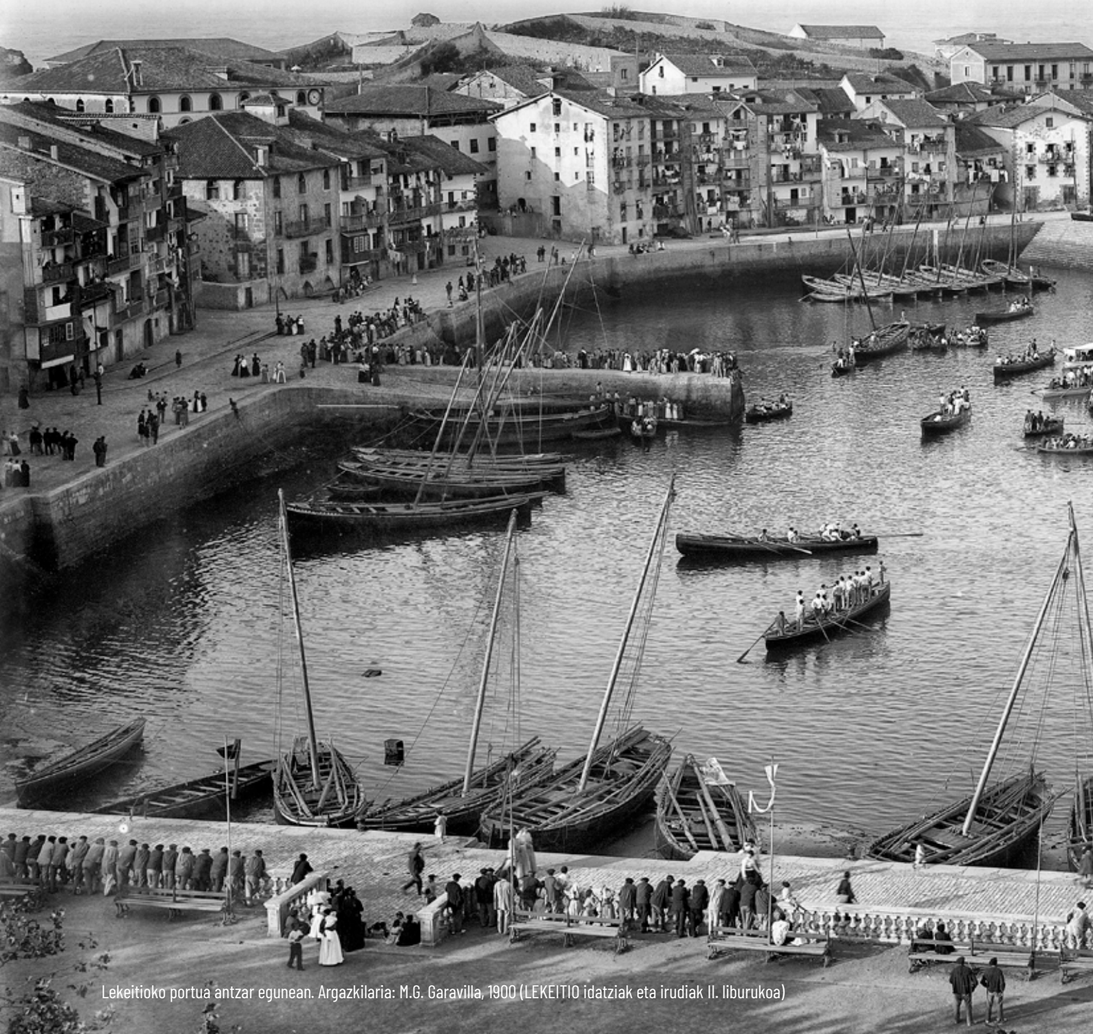
Lekeitioko portua antzar egunean. Argazkilaria: M.G. Garavilla, 1900 (LEKEITIO idatziak eta irudiak II. liburukoa)