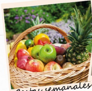
Cestas semanales a domicilio