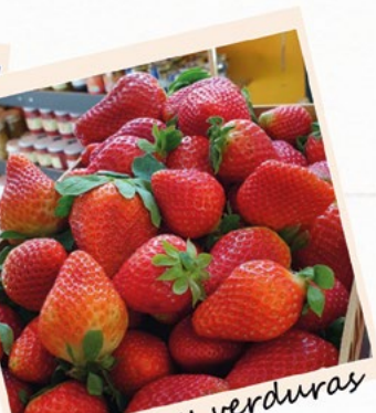
Frutas y verduras de calidad