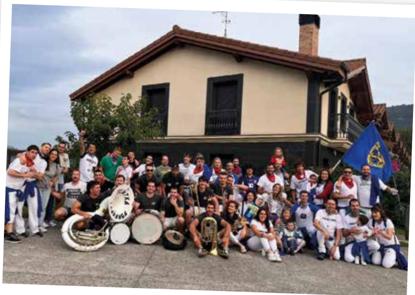
10º aniversario de la Peña KALEZ KALE peñaren 10. urteurrena (2014-2024)