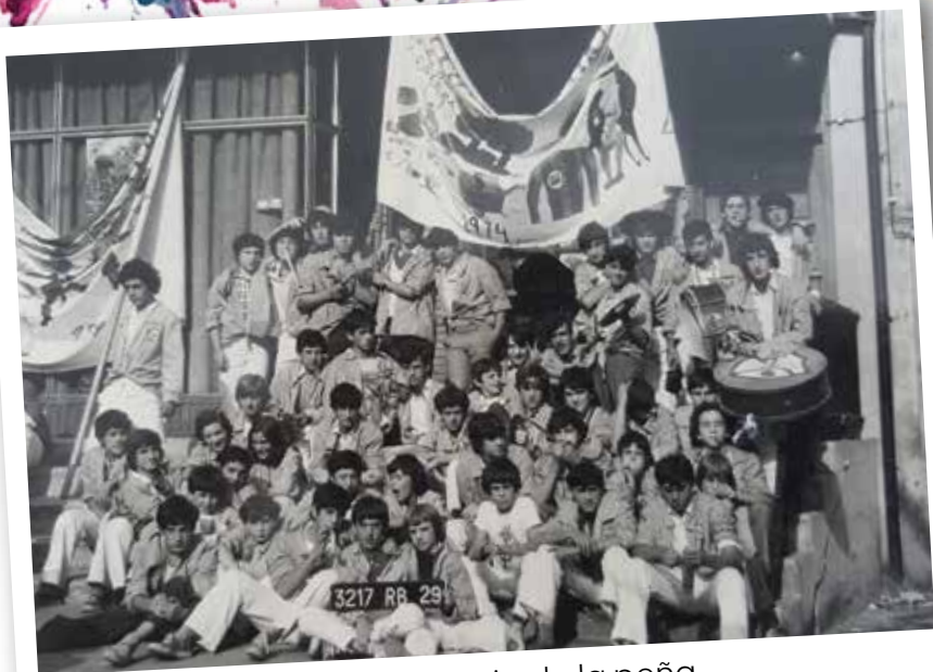
50º aniversario de la Peña MUTHIKO TXIKIAK peñaren 50. urteurrena (1974-2024)