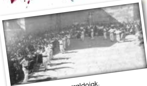
1944 Lehenengo erraldoiak. Primeros gigantes.