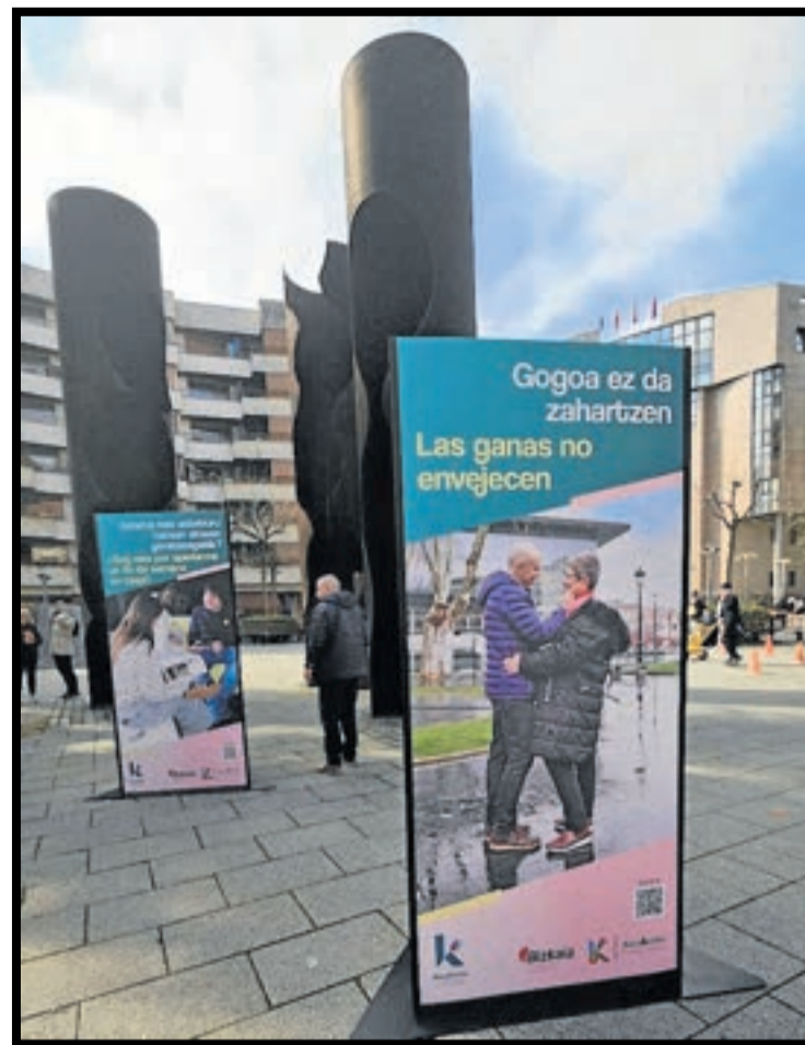
Algunas de las imágenes que componen la exposición.

LA EXPOSICIÓN FOTOGRAFICA HA SIDO POSIBLE GRACIAS AL TRABAJO DE REFLEXIÓN Y PARTICIPACIÓN DE LOS MIEMBROS DEL GRUPO MOTOR DE BARAKALDO LAGUNKOIA E INTEGRANTES DE LA PLATAFORMA JUVENIL GILTZARRI DE BARAKALDO.