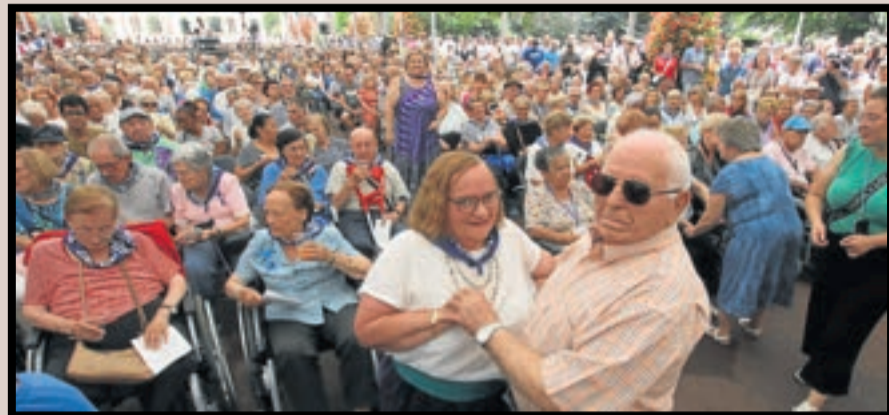
Personas mayores participando en la Aste Nagusia de Bilbo.

Según los últimos datos de Eustat, publicados a finales de 2023, la esperanza de vida se sitúa en 83,4 años, una cifra que ha experimentado un constante aumento en las últimas décadas, al pasar de los 73,3 años de 1976 a los 80,1 años de 2001 y a los 83,8 de 2019, cifra desde la cual ha descendido hasta los 83,4 de la actualidad. Un descenso que se atribuye a la sobremortalidad