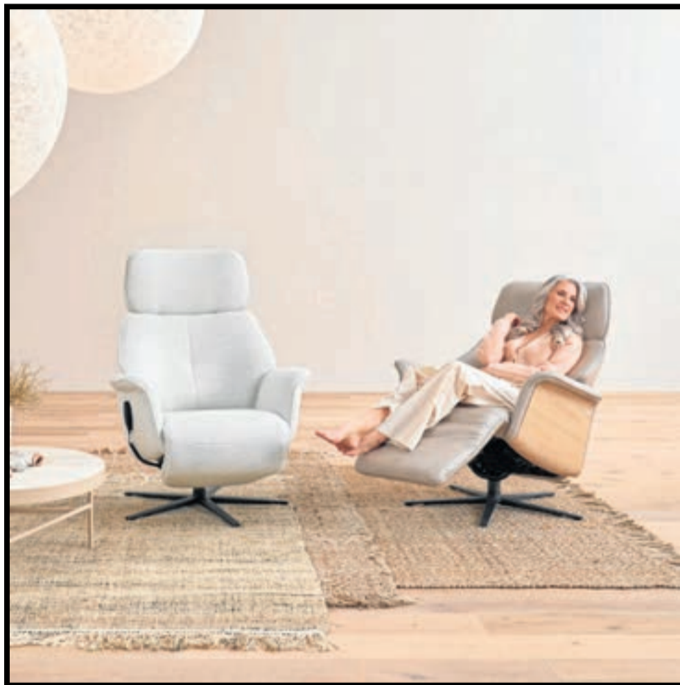
Nuestra salud y bienestar dependen en gran medida de la butaca que elijamos. SUIT DELUXE

Butacas motorizadas con funciones de masaje y relax, con posiciones para ayudar a incorporarse o a sentarse, e incluso para favorecer la circulación de las piernas o el alivio del corazón. Las opciones son muy variadas, por lo que una buena elección resulta crucial.